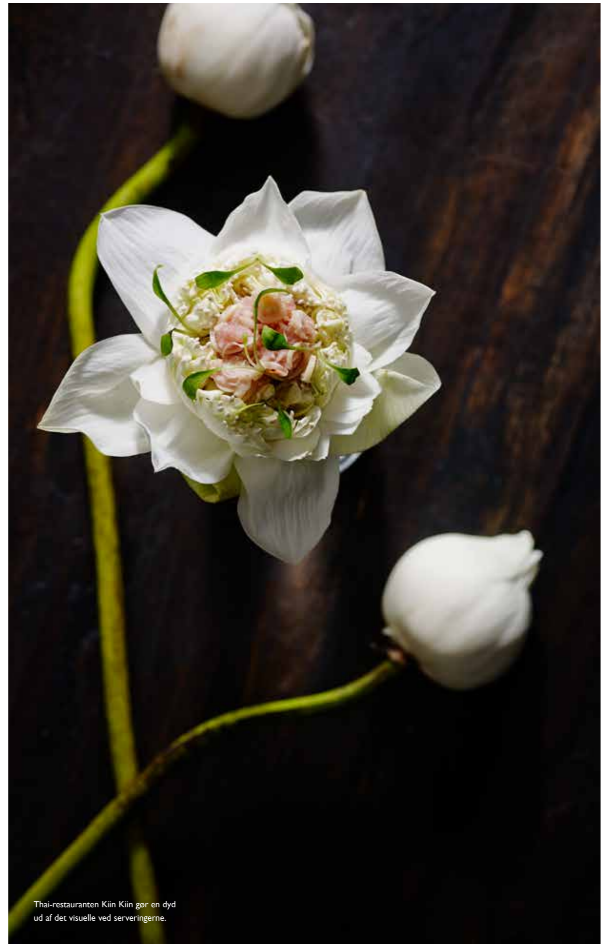
Thai-restauranten Kiin Kiin gør en dyd ud af det visuelle ved serveringerne.