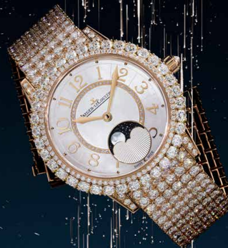
108 diamanter danner to koncentriske ringe omkring "The Dazzling Rendez-Vous Moon" og ikke mindre end 310 diamanter (der vejer mere end 22 karat) i den fuldt besatte lænke skaber en flod af diamanter, der vikles rundt om håndleddet – blødt som et silkebånd.

Den overdådige, fuldt besatte urlænke er et sandt mesterværk af smykkekunst: Jaeger-LeCoultres juvelerer har sat ikke mindre end 310 diamanter (22,27 karat) sammen for at danne en flod af diamanter, der vikles rundt om håndleddet – blødt som et silkebånd.