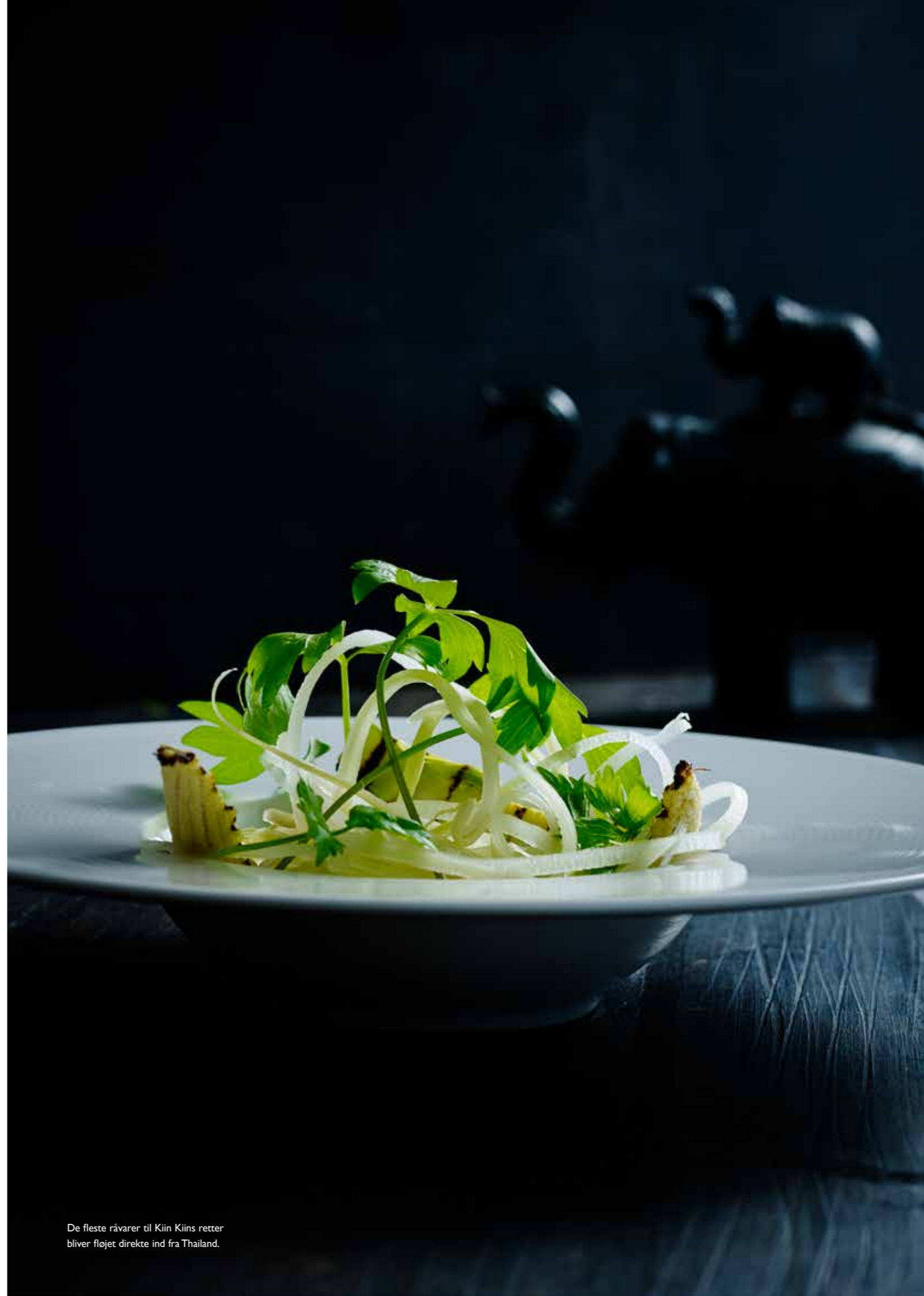
De fleste råvarer til Kiin Kiins retter bliver fløjet direkte ind fra Thailand.

Kreativiteten, talentet og stædigheden er ikke bare nu en del af Daks personlighed. Den er også blevet Kiin Kiins.