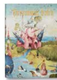
Hieronymus Bosch – Complete Works, Stefan Fischer, hardcover med folde-ud-sider, 29 x 39,5 cm, 300 sider, 1.000 kr. hos Taschen

Men det lå også i tiden. Det kan godt være, Bosch gik planken ud og malede skørest af alle, men samtidigt som landsmanden Mathias Grünewald malede også sære, lemlæstede kroppe. Og den berømte Lucas Cranach den Ældre, der et halvt århundrede før Bosch malede St. Antonius' fristelse, viser helgenen omgivet af djævelske kvindelignende kroppe med vinger og fuglekløer. Med andre ord: Boschs kolleger holdt sig heller ikke tilbage fra mere end at pirke til fantasien. Bosch forbliver dog originalen. ■